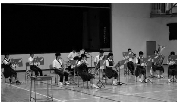
▲校内で発表を行う吹奏楽部