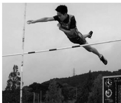
▲代替大会で競技を行う陸上部