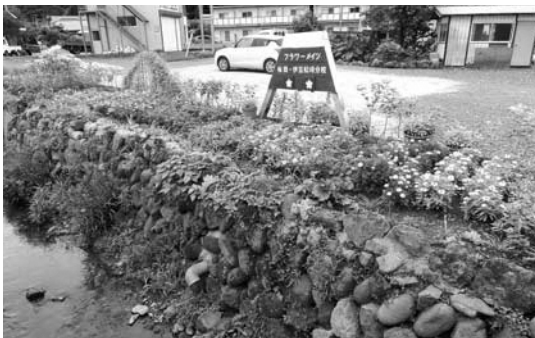
優秀賞 桜田区・フラワーメイツ（桜田）