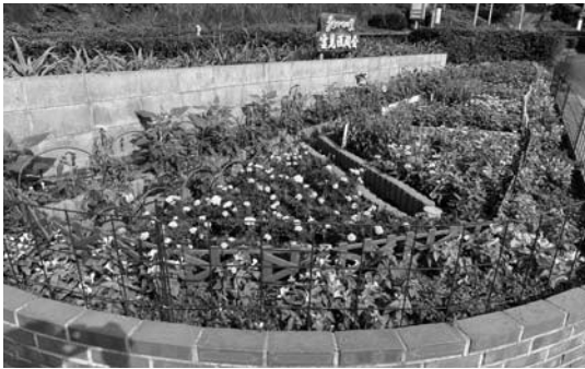
最優秀賞 浅間会（雲見）