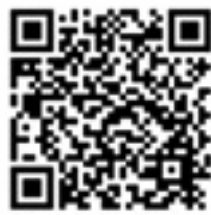
▲ウォーターセーフティガイド

ウォーターアクティビティについて、誰もが安全に安心して楽しむために知ってほしい情報をまとめた総合安全情報サイトです。