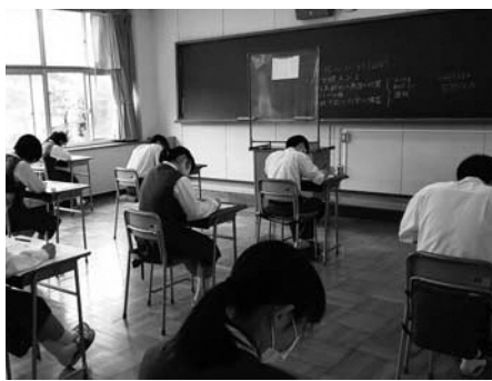
▲窓を開放するなど感染対策に留意した授業の様子

当たり前の日常が一日も早く戻れることを願いつつ、感染対策にも十分留意し、教育活動に取り組んでいきます。