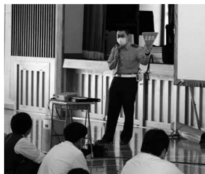
▲交通係長による交通講話

交通係長による実体験を交えた交通講話、現実の事故場面も盛り込んだDVD視聴、指導員による実技指導を含めた自転車実験などを通して、交通安全の大切さについて学ぶことができました。