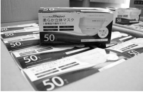
▲役場に届いたマスク