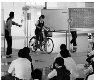
▲指導員による実技指導

本校は自転車による通学者は全体の3分の1程度ですが、通学以外も含めるとほとんどの生徒が自転車を使っています。これからも交通ルールの遵守と交通安全の向上について、意識を高めていきたいと思えます。