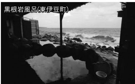
▲温泉は地下のマグマだまりによって温められた地下水

温泉もジオの恵みです。火山はいつたん噴火すれば災害をもたらしますが、マグマの熱が地下水を温めるので、あちこちで温泉が出ています。私たちの生活は、大地に深い関係があります。