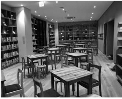
▲家具一式を製作した グランベリーパーク内の図書館

その他、実践型の活動として、平成30年に手掛けた「湘南リトルツリー（平塚市）」カフェの家具製作に続き、東京町田市に新規オープンした大型複合施設「グランベリーパーク」内の図書館内家具製作一式を請負い、製作の過程を細かく生徒に教えながら授業を行いました。