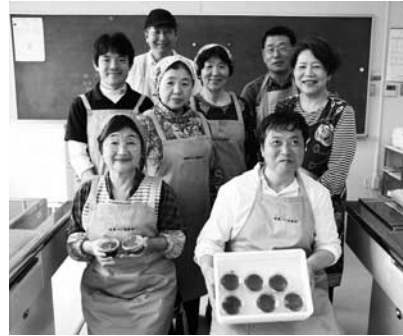
▲桜葉ファン倶楽部の皆さん

次に、松崎稲作塾での活動です。自然豊かな松崎町で行う農業はとても魅力的ですが、農家でもない人間が農業に触れることはなかなかありません。そこで、町内の農家さんたちと一緒に、農作業体験の機会を企画しました。SNSを通して関心を持つてくださる方も増え、町外の学生にも参加していただくことができました。松崎町ならではの農の魅力は、これからの武器になると考えています。最後に、子どもたち向け