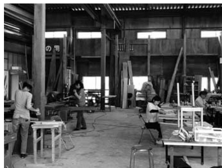
▲松崎工房での作業風景

会、松崎町役場、松崎町の仲間との協力を得て、松崎工房を開設し2年8カ月が経過しました。