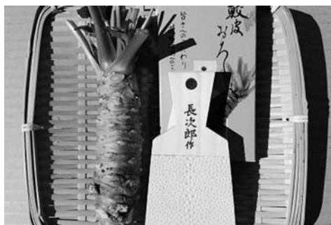
▲1位 伊豆のわさびセットE