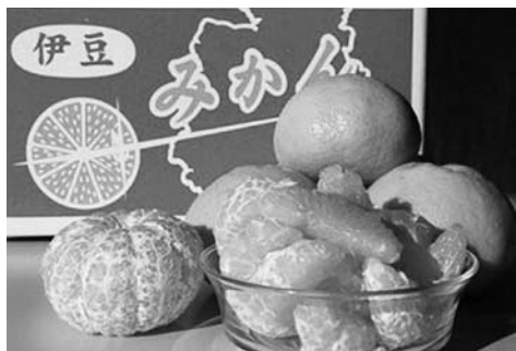
▲2位 加賀農園 はるみ