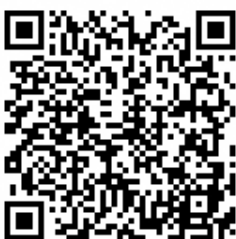
▲「静岡県防災」静岡県ホームページ

また、「マップ・避難場所等」では、付近の避難場所を確認することができます。災害は自宅にいる際に起きるとは限りませんので、普段、立ち寄る場所の最寄りの避難場所を確認し、いざというとき、迅速に避難が行えるようにしましょう。