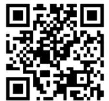
▲伊豆半島ジオパーク推進協議会ホームページ

〒410-2416 伊豆市修善寺838-1 伊豆半島ジオパーク推進協議会「ジオ検定」係