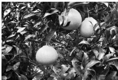
▲3位 鈴切農園 不知火（しらぬい）