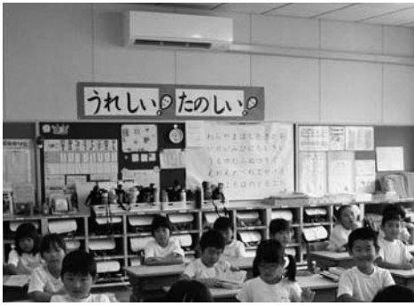
▶ エアコンが設置された小学校の教室

近年、町内でも真夏日を記録することが増え、夏場の教室内の温度が30度を超えることも多くなりました。昨年の夏は記録的な猛暑となり、厳しい暑さの影響で全国各地においても、熱中症による死亡事故や救急搬送が相次ぎました。また、愛知県では、小学1年生の児童が熱中症で死亡する痛ましい事故が起きました。