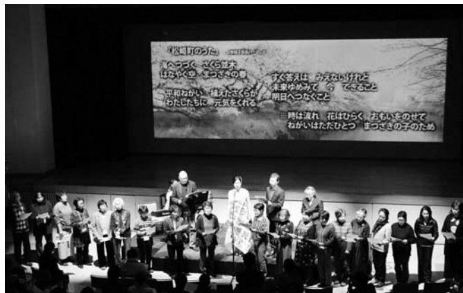
▲昨年12月に開催したクリスマスコンサートの様子

「松崎町のうたを育てる会」がいろいろな人と関わり、つながりを広げ、自分が住んでいる町に誇りや郷土愛を持つてもらおうことにあります。一人一人が関わることで、町民全体が自分たちの歌だと実感してほしいです。誰かが作った歌をもらうのではなく、松崎に住んでいる自分たちの手で作っていくことが大切だと思っ