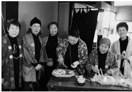
▲繭最中完成お披露目会の様子

に、繭最中を通して松崎町の歴史をPRすることを目的として実施しました。3月31日、繭最中の完成お披露目会が旧依田邸にて開かれ、多くの人でにぎわいました。