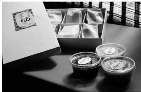
▲カリッとした最中の食感を残すため餡は自分で詰めます

販売価格は、5個入り600円、10個入り1200円です。であり村・蔵らにて販売しているほか、店内では、お茶とセットで食べることもできます。