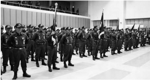
▲整列する消防団員