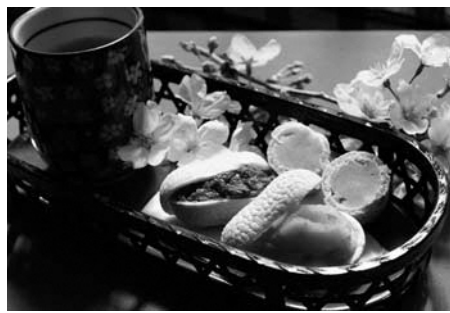
▲繭最中「伊豆松崎まゆこ」

このたび、ふるさと納税を活用したクラウドファンディングにより資金を集め、町とであい村・蔵らの協働で進められていた特産品開発事業により、繭最中「伊豆松崎まゆこ」が完成しました。