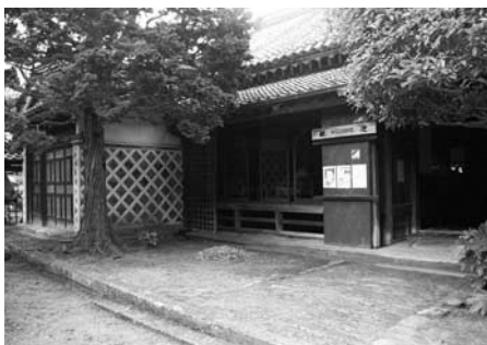
▲整備を進めている旧依田邸

そして、旧依田邸については、温泉施設を復活させ、観光・文化交流拠点とすべく、いよいよ整備改修工事に着手し、来年4月のオープンを目指します。