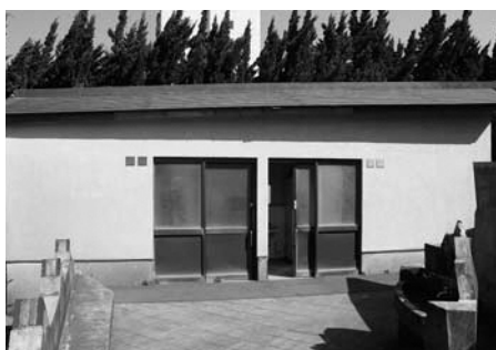
▲改修予定の松崎海岸公衆トイレ

また、観光客の方へのイメージアップを図るため、公衆トイレの洋式化、ウォッシュレット化を進めるとともに、景観上好ましくない老朽化した節水型トイレは解体する等、町の賑わいを再生すべく取り組んでまいります。