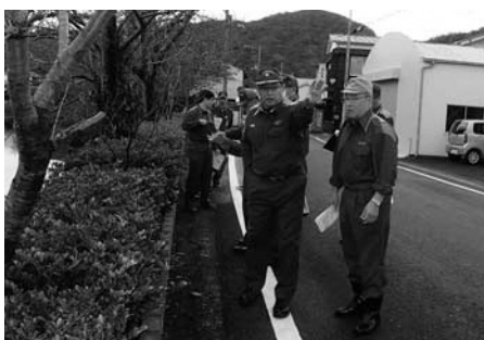
▲下田地区消防組合等との現地確認

各地区の区長さん、役場職員での地区の巡回は継続し、日頃から避難路や避難場所の状況を確認するとともに、危険箇所については、優先順位をつけて整備してまいります。