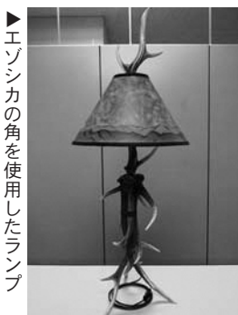
▶エゾシカの角を使用したランプ