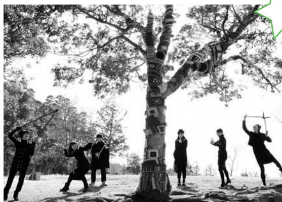
▲牛原山でつくったヤーンボミング(昨年2月まで展示)