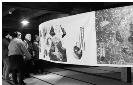
▲「マツタキ今昔物語絵巻」完成披露展示会の様子