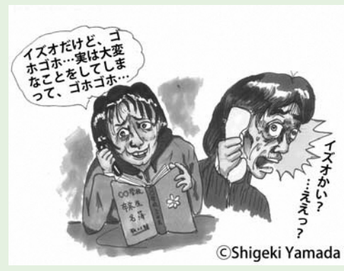
【問合せ】 企画観光課 (42)3964 (文と絵) 司法書士 山田茂樹

最近、近隣の市町では、 「〇〇(息子の実名)だけ ど・・」と息子の名前を 名乗り、「風邪ひいちゃつ ているんだけど・・ゴホ ゴホ」等として、電話を かけてくるケースがあり