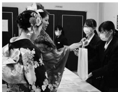
▲成人式ボランティア

学習への理解を深めることを目的に、平成14年度から活動を始めました。今年度は68人が登録し、さまざまな活動に参加しました。活動は、夏休みや土日を中心です。特に夏休みは活動が多く、主な活動としては、松崎海岸の清掃、イベント等の手伝いを行いました。