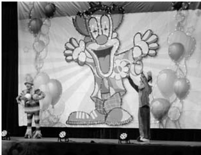
▲ピエロのスーパーサーカス

松崎小学校PTA教室部との共催で、11月24日に生涯学習公演「ピエロのスーパーサーカス」を開催しました。目の前で行われる数々のパフォーマンスが成功するたびに、歓声や拍手が起こりました。