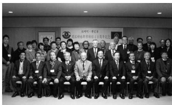
▲帯広市役所へ表敬訪問