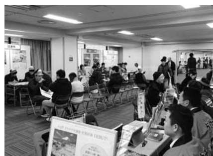
▲静岡まるごと移住フェア(東京)の様子