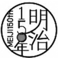
▲明治150年 ロゴマーク

明治以降、近代国家への第一歩を踏み出した日本は、この時期において、近代化に向けた歩みを進めることで、国の基本的な形を築き上げていきました。近年、人口減少社会の到来や世界経済の不透明感の高まり等、激動の時代を迎えており、近代化に向けた困難に直面していた明治期と重なるところもあることから、改めて明治期を振り返ってみてはいかがでしょうか。