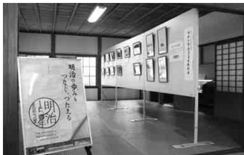
▲明治の学舎写真展特別展