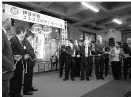
4月18日に行われた記念式典

は、国内では9地域目ですが、2015年に世界ジオパークがユネスコのプログラムとなつてからは、国内初の認定です。全世界では、38カ国140地域が認定されています。