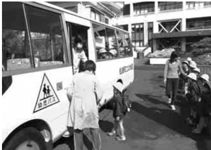
幼稚園児の登園の様子

とともに、普段から地域ぐるみであいさつや声掛けを行うことが大切です。地域の皆様から、あいさつや温かい言葉を受けた子どもたちは、安心感を抱き、自尊心や自己肯定感が高まる等、健全育成への効果も期待されます。 この運動を実践につなげるためには、学校・家庭・地域の連携が不可欠です。特に、地域の皆様には、登下校中の児童・生徒への声掛けをお願いします。 今後も三つの実践運動を推進し、地域ぐるみで「心地よいあいさつが溢れる町」を目指していきましよう。