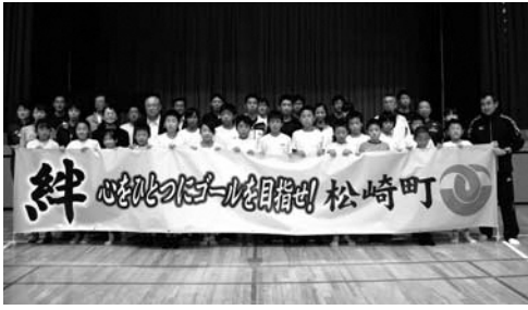
第19回大会松崎町チーム集合写真