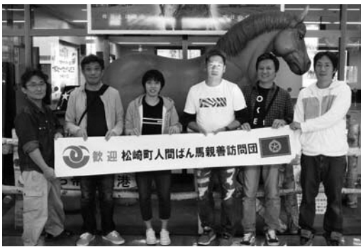
▶伊豆国松崎開拓団の皆さん

今年度は姉妹都市締結40周年を記念して、帯広市民からなる訪問団を松崎町に派遣し、住民同士の交流を深めました。