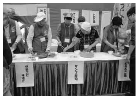
▲フェスティバル料理提供の様子

協議会は、静岡県と「リバーフレンドシップ制度」・「しずおかアダプトロードプログラム」の同意書を締結し、伏倉親水広場の河川美化、県道15号線（宮の前橋く伏倉橋）の道路美化活動を行っています。昨年7月には、中学生約10