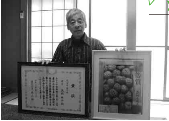
▶昨年度、「静岡県乾しいたけ品評会」に出品した椎茸の写真と受賞した賞状