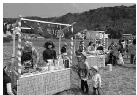
▲案山子設置の様子

「田んぼをつかった花畑」にリアル案山子を設置して、訪れる人に楽しんでもらおうと、平成26年度に始まり、3年目となりました。今回は「花畑の露店」をテーマとし、焼きそばやたこ焼き等の屋台を構え、約30体の案山子を設置しました。本物そっくりの案山子が来場者にとっても好評でした。また、案山子作りには会員だけでなく、多くの住民が参加し、楽しみながら製作を進めました。