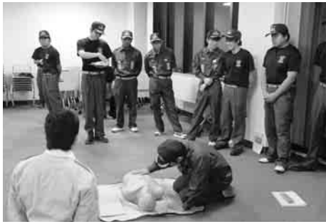
普通救命講習の様子

きな地震が発生した場合は、ライフセーバー、観光協会、自主防災組織と協力し、海水浴客の避難誘導を行います。各海水浴場から避難する場合は、松崎海水浴場は避難ビルとなつている「伊豆まつざき荘」か「伊東園ホテル」または「西区津波避難タワー」へ、岩地・石部・雲見海水浴場では、避難誘導の指示や誘導看板に従つて近くの高台へ避難してください。