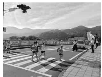
昨年の街頭指導の様子