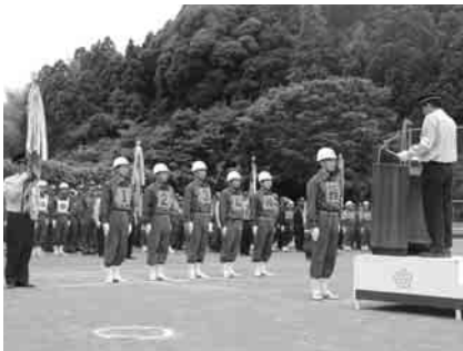
▲表彰を受ける第1分団第1小隊