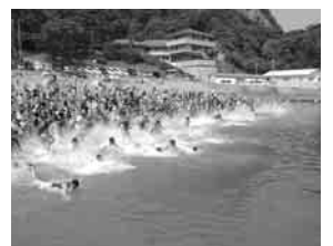
昨年の「雲見温泉サザエ祭り」の様子