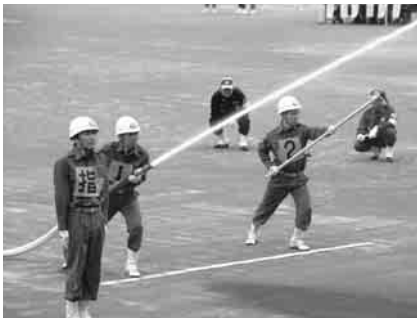
▲第6分団の競技の様子