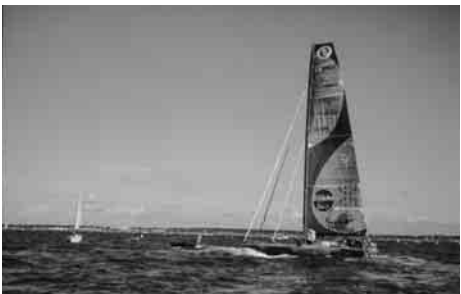
「ヴァンデ・グローブ」出場中の白石氏と、船の「Spirit of yukoh (スピリット オブ ユーコー)」