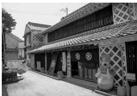
調査を実施した明治商家中瀬邸

会」を立ち上げ、意見交換会を開催し、なまこ壁の建造物活用に関するモデル計画を策定しました。今後、景観計画策定に向けた取組みの中で、より具体的な保存方法や保存地区を検討していきます。