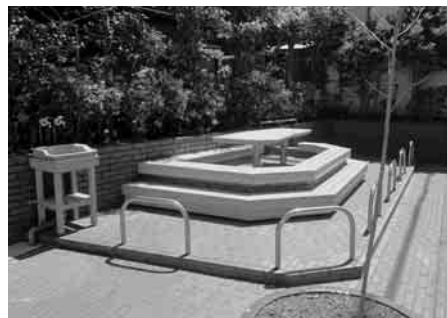
商店街に設置された足湯

商店街の利用されなくなったポケットパークを活用し、お弁当や商店街で購入したものを広げて食べられるように設計された足湯を整備しました。他施策と絡めて、商店街を人が歩くための取組みを進めていきます。また、町にある多様な温泉資源の利用を促進するとともに、観光地としての魅力向上により、交流人口拡大や雇用促進を目指します。