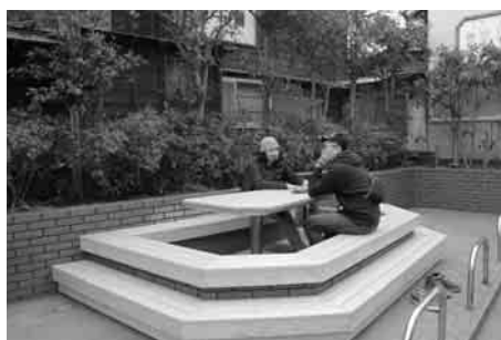
ポケットパーク足湯