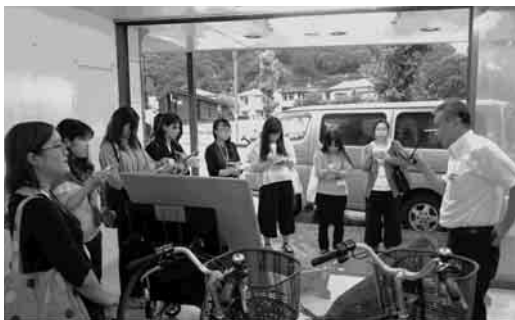
常葉大学造形学部のフィールドワーク

ら1名、東北芸術工科大学から1名のインターンシップを受け入れました。また、静岡大学地域創造学環や常葉大学造形学部のフィールドワークを受け入れ、地域振興への課題提供を行うとともに、課題解決に向けた事業を大学へ発信しています。引き続き、インターンシップ等を積極的に受入れ、相互のスキルアップ（技術・能力等の向上）を目指します。