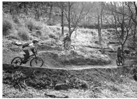
牛原山に整備されたマウンテンバイクコース

県有林では県内初となるマウンテンバイクコースを牛原山に整備し、これまでと異なる客層が見られるようになりました。オリンピックの自転車競技2種目が伊豆半島で開催されることを見越して、インバウンド（外国人旅行者の誘致）にも力を入れていきます。