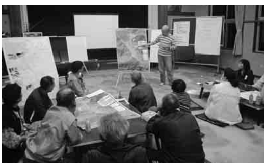
津波対策ワークショップ

津波対策ワークショップを開催し、ハード整備と合わせた地域ごとに関連誘導体制の重要性を確認するとともに、防災意識の高揚が図られました。今後も引き続き、防潮堤や避難計画の整備を進めていくとともに、観光客も含めた避難誘導体制の整備を進めていきます。