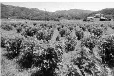
桑畑となった耕作放棄地

桜葉の有機栽培方法について、農業者と検討を重ね、ハウスを利用した有機栽培を始めています。引き続き、（二社）伊豆松崎町桜葉振興会等と協働し、有機栽培を試験的に実践していき、高付加価値の作物の開発に繋げていきます。