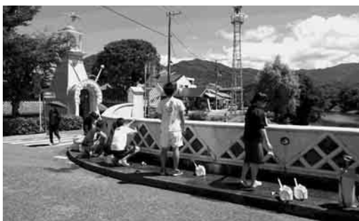
松崎高校生徒会によるなまこ壁クリーニング

看板の作製、サイエンス部をはじめとした里山ファクトリー（牛原山整備計画策定への取り組み）への参加等により、地域との関わりを広げています。郷土愛を育み、より一層地域との関わりを持ち、高校生が地域で活躍する姿を発信することにより魅力の向上を図ります。