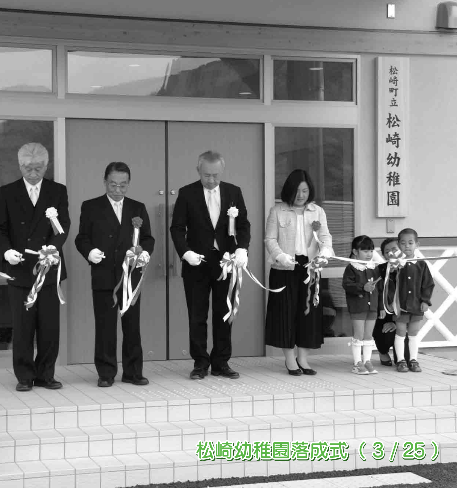
松崎幼稚園落成式 (3/25)