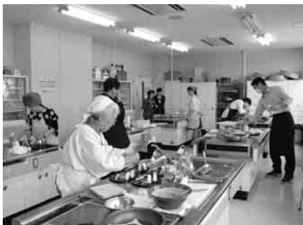
桜葉コンテスト「調理実演」の様子