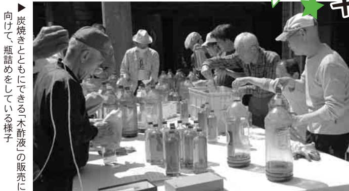
▶ 炭焼きとともにできる「木酢液」の販売に向けて、瓶詰めをしている様子

です。皆で賑やかに集まり、作業の間に山で食べる昼食はとても美味しいです。近年、鹿が木の新芽を食べてしまい、木を確保するための対策も必要になってきました。今後は、材料である木と活動できる仲間がいる限り続けていきたいです」と話してくれました。