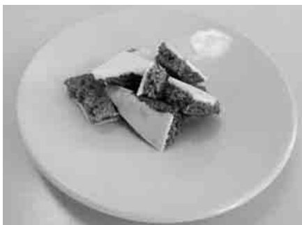
桜葉スイーツ試作品（橋本屋「桜クロッカン」） 販売中