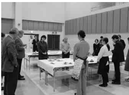
桜葉コンテスト「最終審査」の様子