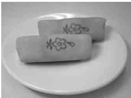
桜葉スイーツ試作品（株）梅月園「さくらろまん」 販売中