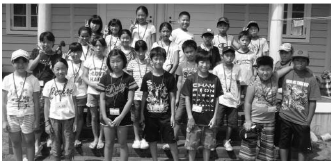
三聖会堂にて記念撮影

今年度は26人が参加し、7月29日から8月1日までの日程で、朝・夕食を仲間と協力して自炊しながら、「自然・体験！『ふるさと』とかわり、つながろう！」をテーマに活動しました。