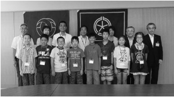
表敬訪問にて記念撮影

一行は、帯広市役所への表敬訪問や依田勉三翁のお墓参り等の他、アイススケートで帯広の子どもたちと交流を深めました。