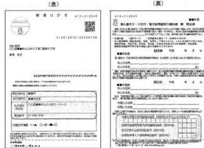
(表) (裏) ▲ 交付通知書 (イメージ)

個人番号カードの取得を希望される方は、個人番号カード交付申請書に必要事項を記入し、顔写真を貼り付け、申請書返信用封筒に入れて郵送します。