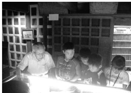
三余資料館を訪問

4日間の活動では、町内で活動している方の指導を受け、自分たちの食事となる干物作り体験・ピオトープ作り・アユ釣り体験・防災講座・三聖にゆかりのある三余資料館の訪問・「日本で最も美しい村」学習会・理科実験教室・座禅体験・まゆ玉人形作り等を行いました。