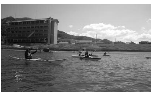
毎週土曜日のカヌー訓練

宿泊体験学習中は、三聖苑内への車の進入を制限させていただいたおかげで、安全に活動することができました。皆様のご理解ご協力ありがとうございました。