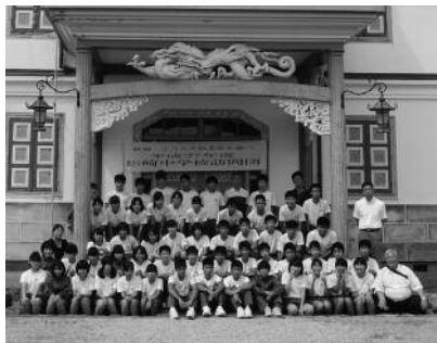
旧開智学校を見学

一行は松本市到着後、重文岩科学校と姉妹館提携を結んでいる旧開智学校や松本城を見学しました。