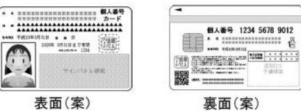
表面(案) 裏面(案) ▲ 個人番号カード (イメージ)

なお、個人番号カードを交付する際には、お持ちいただいた書類の確認や、申請者の本人確認を行ったり、暗証番号を設定したりするため、多少のお時間をいただくことになります。