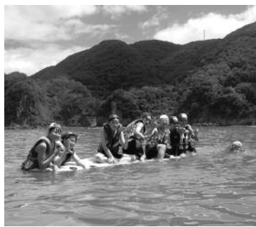
岩地海岸で海水浴

2日目は岩地海岸で海水浴を行いました。台風の影響で地引網はできなかったものの、湾内でシーカヤックを体験する等岩地の海を満喫しました。