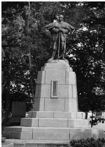
中島公園の「依田勉三の銅像」

中川郡幕別町字依田の地名は、勉三率いる晩成社途別農場があったことに由来します。この地一帯では、明治33(1900)年頃から晩成社により稲作が行われ、十勝水田発祥の地とされています。同町札内地区にある「みずほ町」の地名と「いなほ公園」の名称はこれに由来しています。勉三がこよなく愛した十勝の大地。明治16年に晩成社一行27人が入植してから130余年。現在、人口約35万人、耕地面積約25万畝、乳用牛と肉用牛の飼育頭数は計43万頭、食料自給率1100%、日本の食糧基地として発展しています。