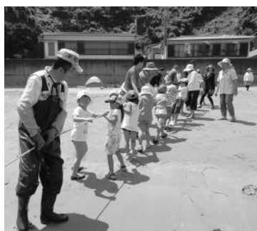
地引網体験を楽しむ園児

り体験や田んぼで泥んこ遊びを行いました。泥んこ遊びでは、最初は恐る恐る泥を触っていましたが、慣れてくると体中泥まみれになりながら楽しんでいました。