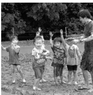
泥んこ遊びを楽しむ園児

松崎町での3泊4日の滞在中は、常葉大学や町内外の多くのボランティアの協力のもと、石部柵田保全推進委員会を中心に受け入れを行いました。