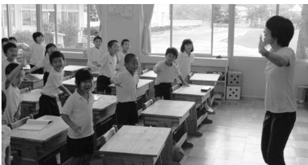
「松崎の長八さん」の踊りを練習する小学生

小学生は、1学期からこの祭りのためにみんな一生懸命練習を重ねていますので当日はぜひ、かわいい子どもたちの姿を見に会場に足を運んでいただくとともに、皆様も踊りの輪の中にご参加ください。