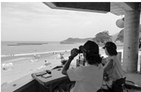
ライフセーバーによる監視