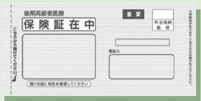
▲こちらの「黄色の封筒」で新しい保険証を郵送します。