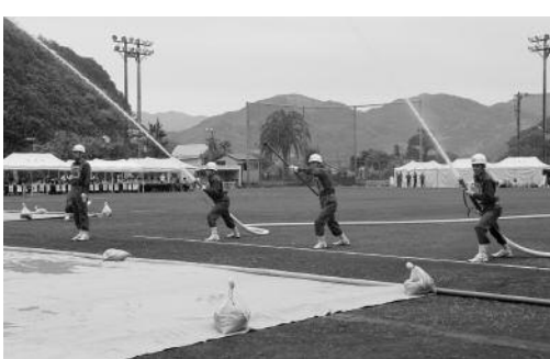
ポンプ車操法の部