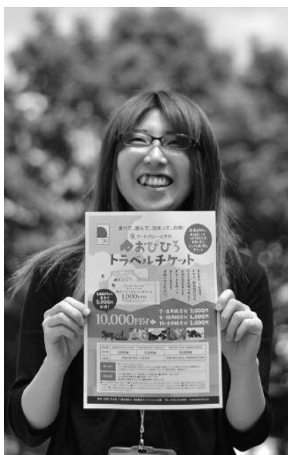
▲「おびひろトラベルチケット」を利用して、帯広を堪能しませんか

帯広市は広大な十勝平野の中央に位置し、澄み渡る大きな青空、どこまでも続くまっすぐな道等、北海道の雄大さを象徴する景色が広がっています。また、きれいな水やおいしい空気、肥沃（ひよく）な大地で育まれた安全・安心な農畜産物の一大生産地であり、それらを使用したグルメは帯広の最大の魅力です。