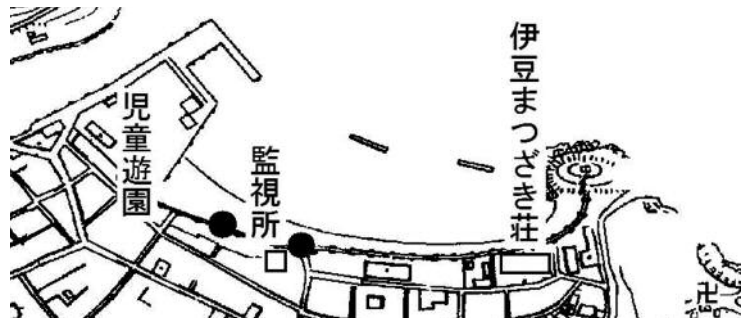
松崎海水浴場区域