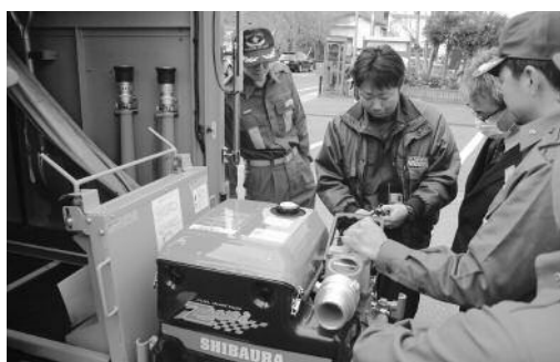
ポンプの取り扱いの説明を受ける団員

両小隊の消防車両は、平成6年から20年以上使用されてきましたが、老朽化が進んだため、今回更新されました。式終了後には、ポンプの取り扱いの説明を受け、操作の確認を行いました。