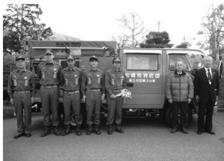
第3分団第3小隊（峰輪）

松崎町消防団第3分団第3小隊（峰輪）と第6分団第3小隊（雲見）の消防ポンプ積載車が更新され、3月15日に引渡式が行われました。