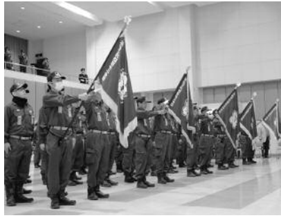
整列する消防団員

平成27年度松崎町消防団入団式が4月1日に環境センター文化ホールで挙行されました。