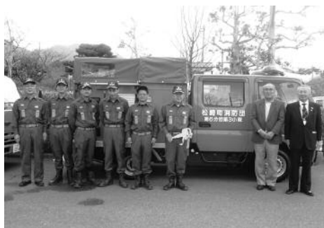
第6分団第3小隊（雲見）

式では、町長から団長へ鍵の引き渡しが行われ、町長は、「消防ポンプ積載車として機動力を発揮し、関係自主防と有効に活用してほしい」とあいさつを述べました。