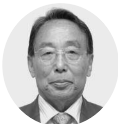
稲葉 昭宏 議員