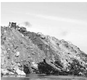
持ち込まれた雪による雪山

帯広市では、冬の間、道路に積もった雪が10〜15センチとなると除雪車を出動させています。除雪を行う市道の延長距離は、帯広市と松崎町の直線距離984メートルの約1.4倍の1,345メートルもあります。昨冬の降雪量はほぼ昨年並みでしたが、一度に降った量が多かったこと等から、例年6〜7億円かかる除雪費が、昨年度は10億円を超えました。 北海道の冬は、日中の気温も上がらず、道路に積もった雪をショベルカー等で寄せたままにしておくと、春まで溶けず、道路が狭くなったり、見通しが悪くなります。このため、堆積した雪をダンプカーに積み込み、雪捨場に持って