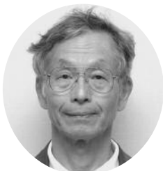
渡辺 文彦 議員