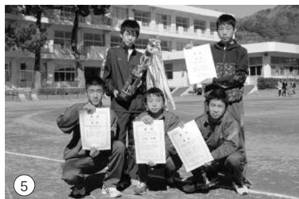
①松崎港をスタート／②第3中継所笹ヶ浜／③小学生男子優勝「松小魂」39分11秒／④小学生女子優勝「びよこびよこべろりん」40分44秒／⑤中学生男子優勝「松中陸上部男子A」34分05秒／⑥中学生女子優勝「松中女子バスケ部A」38分43秒／⑦高校生男子優勝「松崎高スプリンター」38分09秒