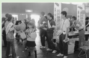
ふれあい広場でボランティア活動 (10月)

生涯学習教室や公演の開催予定については、広報まつざきお知らせ版や回覧等で参加者の募集や案内をしています。詳細は、教育委員会まで、お問い合わせください。