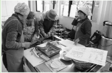
生涯骨太クッキング 講師：松崎町健康づくり食生活推進協議会委員 (11月)

今年度は「デジカメ写真教室」、「大人向け英会話教室」入門、「大人のためのネット安全・安心講座」、「生涯骨太クッキング」、「おもしろ実験教室」、「高血圧予防教室」、「座繰り・機織り体験教室」の7講座を実施しました。また、生涯学習教室の他に、「生涯学習塾」として、プリアーボードフラー教室等を開設しました。