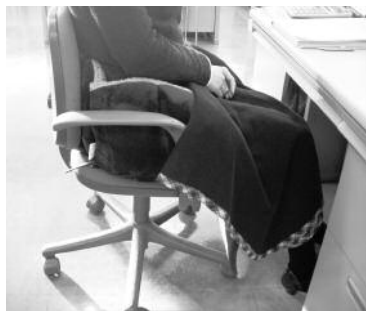
足もとまで完璧です

写真は、職員が自宅から持ち込んだウォームピズグッズの一部です。ふわふわ座布団やかわいい湯たんぽに膝掛け、さらにオフィスルームには、冷気を防ぐために梱包材のプチプチが窓一面に咲いています。