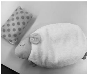
こんなかわいい湯たんぽも！