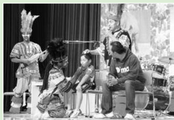
アフリカンミュージック JOYコンサート (11月)

松崎小学校PTA教養部との共催で、生涯学習公演「アフリカンミュージックJOYコンサート」を開催しました。来場者の皆様は、アフリカの音楽や文化を体を使って、楽しみました。