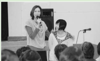
来場者とふれあいながら 講演する大林素子さん (2月)

松崎町体育協会との共催で、元女子バレー全日本エースアタッカーで、現在はスポーツキャスター等として活躍されている大林素子さんを講師に招き「マイ・ドリーム〜夢をあきらめない〜」と題し、講演会を開催しました。