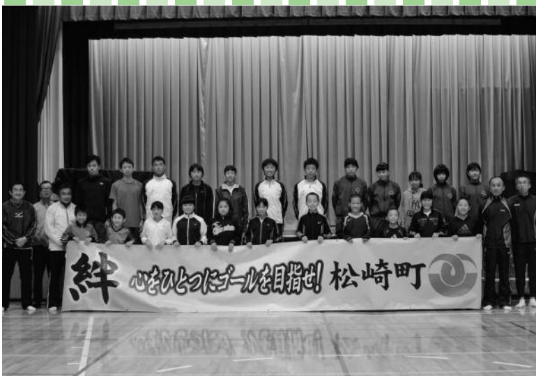
第16回大会松崎町チーム集合写真