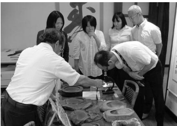
早川町としても有名な産物の硯

早川町は山村留学の費用の全額を負担している唯一の自治体。地域に学校がないと暮らす価値がないというのが町長の考えで、町には小学校が2校、