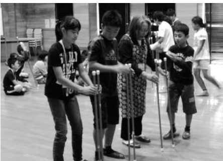
ニュースポーツ大会

その後、スポーツ推進委員の方たちの指導のもと、サポーターの方たちと一緒にニュースポーツ大会を行い、昼食で自分たちが作ったおにぎりを食べ、折り紙を教わって交流を深めました。