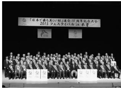
フェスティバルでの記念撮影の様子

妻籠宿、木曾町の木曾馬の里等を巡るツアーが行われ、「日本で最も美しい村」に相応しい歴史的建造物や景観、住民の取り組みを見ることができました。