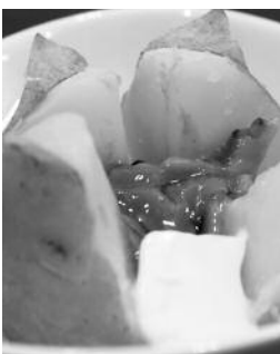
塩辛じゃがバター

十勝産のじゃがいもとバターならなおさら、もうやめられません。なお、十勝産の農畜産物は、JR帯広駅にある「とかち物産センター」等で直送販売されていて、気軽にお買い求めいただけます。ぜひお試しください。