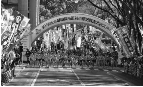
第15回市町対抗駅伝大会の様子