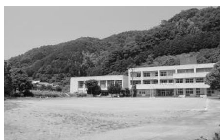
幼稚園建設の適地として 答申された旧岩科小学校敷地

答申を受け、町は、1園の統合場所として答申どおり旧岩科小学校敷地を適地と判断し、7月14日に保護者の方々を対象に説明会を開催し、選択した理由を説明するとともに、今後具体的な園舎の設計に対する意見を聞き、より良い園舎を建設していくことで理解を求めました。