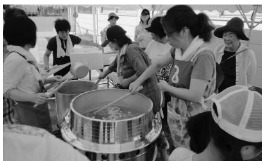
昨年度に富士市で行われた総合防災訓練の様子