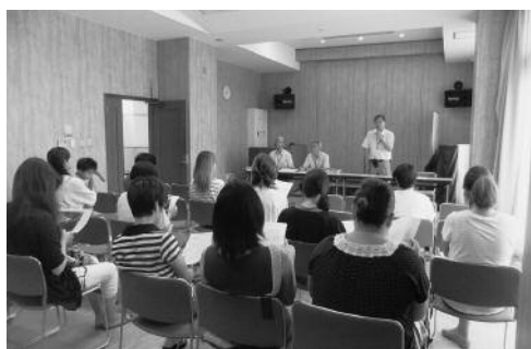
幼稚園統合に関する保護者説明会