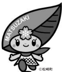
松崎町マスコットキャラクター「まっちゃん」