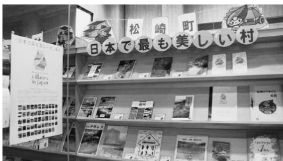
「日本で最も美しい村」連合関連コーナー

町にある棚田等の地域資源について学ぶことができる資料のほか、連合に加盟している他の町村、団体のまちづく