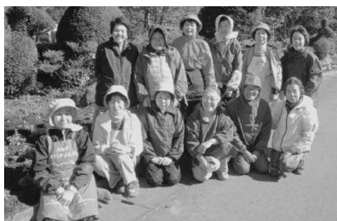
三聖苑花クラブの皆様

三聖苑花クラブでは、一緒に活動してくれる方を募集しています。詳しくは、企画観光課までお問い合わせください。