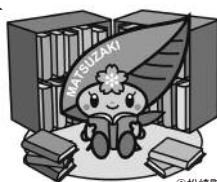
松崎町マスコットキャラクター「まっちゃん」