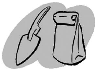
散歩のときは、道具を忘れずに！

フンの後始末は飼い主にとって最低限のマナーです。散歩に連れて行くときは、フンを入れる袋等を持参し、飼い主が責任を持って処分してください。