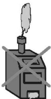
小型焼却炉の使用も原則禁止です！

また、例外に該当する場合でも、ビニールやゴム、タイヤ等は焼却が禁止されています。臭いや煙により周囲に迷惑がかかる場合は注意の対象となりますので、天候や時間帯を考慮して焼却してください。