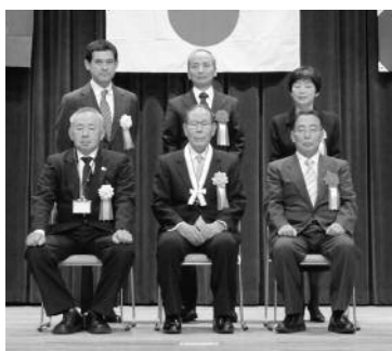
平成26年度松崎町功労者表彰式にて

多年にわたり、民生委員・児童委員として、恵まれない家庭の保護指導、児童の健全育成に献身し、社会福祉の増進に貢献。