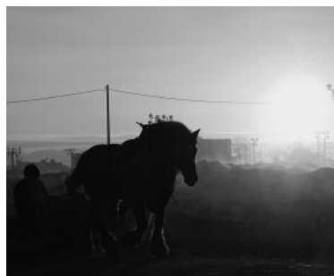
早朝のトレーニング風景

世界で唯一のばんえい競馬と一緒に、松崎町の皆様が夢と希望に向かって駆け上がる年になってほしいと願っています。