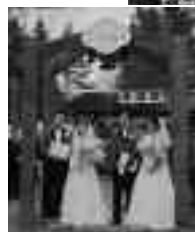
幸福ハッピーセレモニーの様子