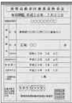
保険証：オレンジ色