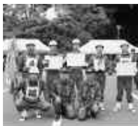
優勝した第1分団第3小隊