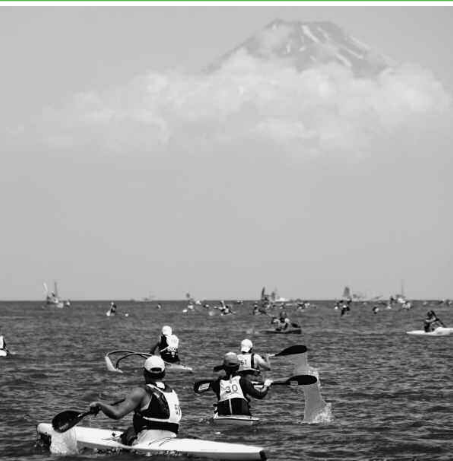
「富士山に向かって！」第15回伊豆・松崎町シーカヤックマラソン (6/2) 岩地海岸をスタートし、雲見千貫門沖で折り返した選手の目の前に、 雲に浮かぶ富士山の景色が広がりました。