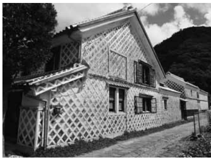
なまこ壁の建造物

建物の壁面に平瓦を貼り、目地を漆喰でかまぼこ状に盛り上げるなまこ壁の建造物は、町内に200棟余り残り、昔ながらの趣を漂わしています。町では、「なまこ壁技術伝承事業」により、技術の伝承や町並みの整備を図るとともに、有志による保全・啓発活動も行われています。