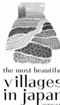
「日本で最も美しい村」連合ロゴマーク

今後、連合の一員として町村・地域、企業、個人サポーターとともに、ブランド価値向上活動やプロモーション活動、組織の強化、連携・交流の強化を図っていきます。