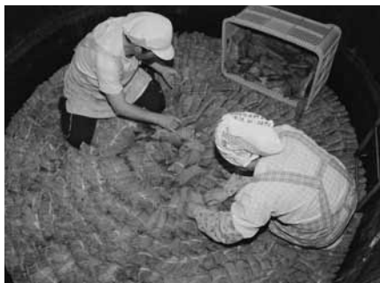
塩漬けのさくら葉

全国シェアの7割を占める塩漬けのさくら葉は、町の特産品です。5〜8月にかけ摘み取られたオオシマザクラの葉は、塩漬けにされ、半年後に甘い香りを漂わせ、その香りは、環境省の「香り風景百選」に選定されています。さくら葉商品は、松崎ブランド品として販売されています。