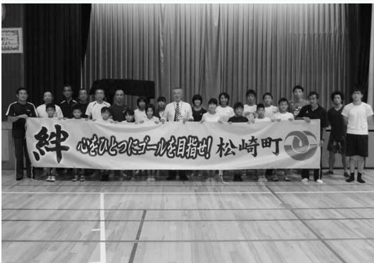
第14回大会松崎町チーム練習参加者 (10月9日記録会にて)