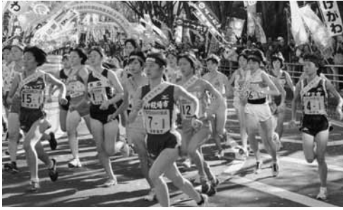
第13回市町対抗駅伝大会の様子