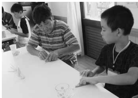
交流昼食会・折り紙遊び

その後、スポーツ推進委員の方たちの指導のもと、サポーターの方たちと一緒にニュースポーツ大会を行い、昼食で自分たちが作ったおにぎりを食べた後、折り紙を教わって交流を深めました。