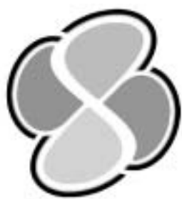
2月1日から改正された高齢運転者標識

普通自動車を運転することができると免許を受けた、年齢が70歳以上の方で、加齢に伴って生ずる身体機能の低下が運転に影響を及ぼすおそれがある方は、普通自動車の前面および後面に高齢運転者標識を表示するよう努めてください。