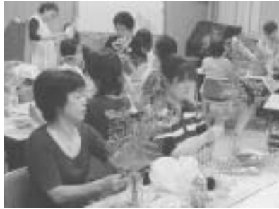
楽しい生け花教室(年3回実施) 講師：文化協会華道部