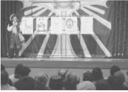
生涯学習公演会 「TOKYOスーパーイリュージョン」

松崎小学校PTA教養部との共催で、生涯学習公演会「TOKYOスーパーイリュージョン」を開催しました。当日の入場者は300人を超え、瞬間移動や空中浮遊などのイリュージョンを楽しみました。