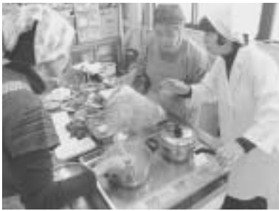
健康増進教室(1,2月2回実施) 講師：松崎町健康づくり食生活推進協議会委員