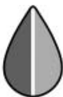
改正前の高齢運転者標識