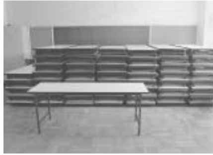
購入したイベント用放送設備と折りたたみテーブル