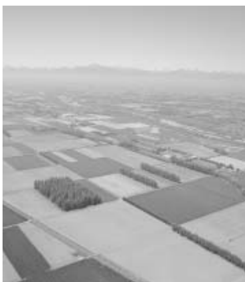
上空から見た十勝平野

とがち帯広空港の自慢のひとつが上空からの眺めです。どこまでも続く広大な十勝平野はまさに絶景です。今秋には札幌までの高速道路も全線開通し、帯広から北海道内の主要な都市へ2〜3時間で行けるようになりま