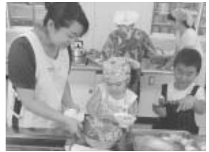
親子(子ども)料理教室(8月実施) 講師：松崎町健康づくり食生活推進協議会委員