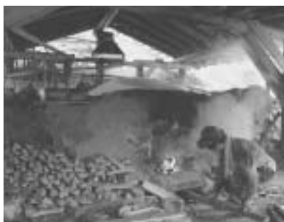
炭焼き窯への火入れ

稲核町会では、昨年、森林管理署が所有していた水殿の風穴を購入し、地域おこしへの活用をはじめています。これに炭窯も加わり、水殿地区にぎやかになってきました。(安曇資料館 山本信雄)