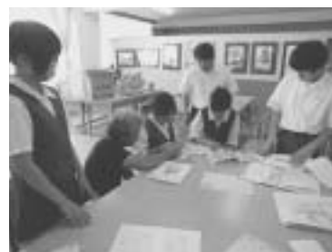
松崎高等学校美術部作業風景

美術館前に土蔵を建築しています。多くの方に饅と漆喰を使ったなまこ壁づくりを通して、左官技術の素晴らしさを体験していただきたいと思います。 松崎高等学校美術部 土蔵ができるまでの過程を絵本にまとめています。左官の技術や芸術性、土蔵づくりに携わる人々を紹介するとともに、伝統的な技法を後世に伝えていきます。