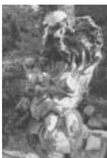
切り株の 特徴を活かした彫刻