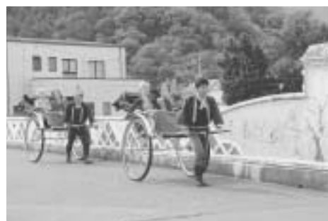
会場へは人力車で

また、人力車伊豆松崎組では、敬老会の思い出づくりのために、十三日、七十六歳から九十三歳までの希望者四人を人力車で会場までお送りしました。