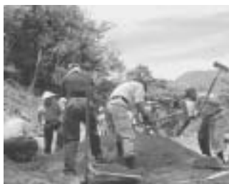
炭窯の天井作り作業