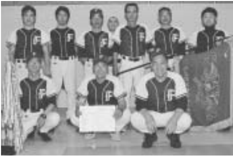
1部リーグで優勝した船田チーム

七月四日に環境センター文化ホールで表彰式が行われました。各リーグのチーム成績は次のとおりです。