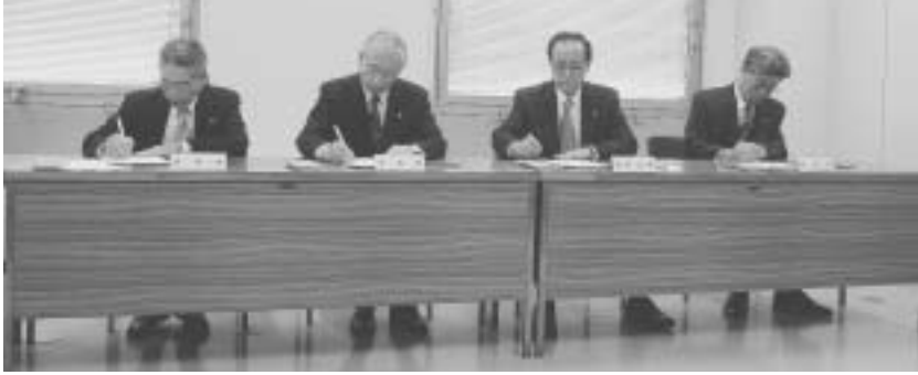
合併協議会設置に関する調印式

合併協議会には会長・副会長を含め各市町から六人の委員が選出され、県職員二人の総勢二十六人により合併の方式・合併の期日・新町の名称・各種事務事業の取り扱いなど、二十六の合併協定項目について協議を重ねていただきます。また、当町では合併協議会前に、合併に関する事前協議及び調査、その他合併に関し必要な事項を協議するため、合併協議会委員で組織する松