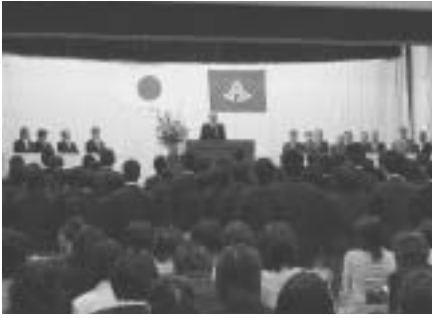
中高一貫教育開始式（4月8日）