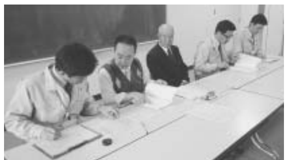
4月4日に提出された署名簿の審査

A 合併に関するあらゆる事項の協議を行う組織です。合併市町村の円滑な運営の確保及び均衡ある発展を図るための基本的な計画の作成、その他、市町村の合併に関する協