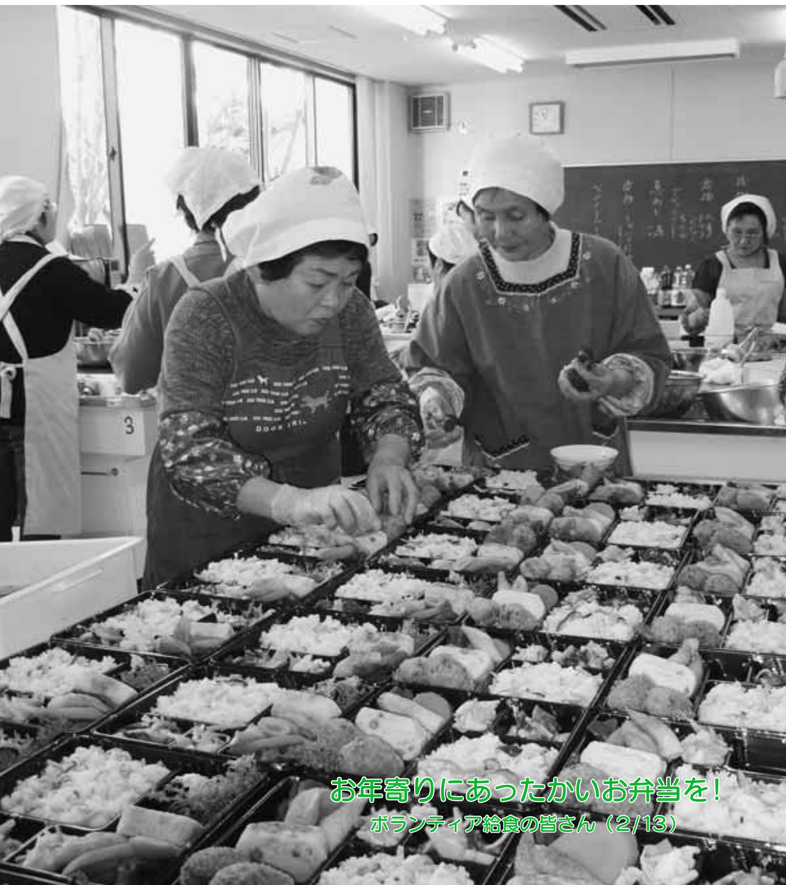
お年寄りにあったかいお弁当を！ ボランティア給食の皆さん（2/13）