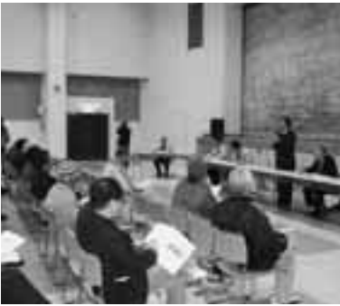
2月1日の説明会（環境センター）

町では二月一日から七日にかけて、南伊豆地区一市三町の合併にかかる地区説明会を町内四カ所で開催したところ、三百八人の参加をいただきました。各会場の参加者および意見質問発言者の状況は表のとおりです。各会場では、合併のメリット・デメリット、財政問題、合併形態、施設整備、行政施策等広い分野に様々な質問や意見が寄せられました。合併協議については、これから時間をかけて行っていくこととなりますので、合併協議会設置後は「協議会だより」等で町の皆さまに的確な情報を提供していきます。