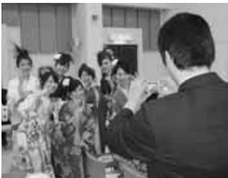
会場のあちこちで記念撮影