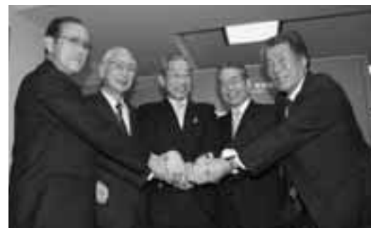
石川知事と4市町長＝県庁(1/23)

する。③河津町長から要望があった地域自治組織の導入を検討する。④法定協議会立ち上げの議決時期は平成十九年度末を目途とし、副市町長を中心に準備を進める。⑤年明け（一月）に、一市三町の市町長が県庁に石川知事を訪ね、合併推進の意向を報告するとともに地域課題に対する支援要請を行う。