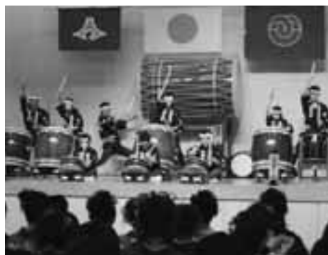
伊豆松崎牛原太鼓の演奏