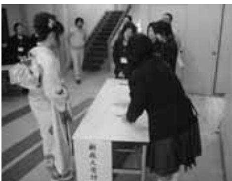
受付は中高生がお手伝い