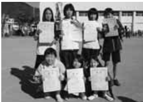
《小学生女子》 ゴンチャンス (松小)