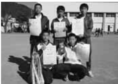
《中学生男子》 陸上部A