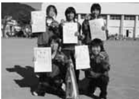
《中学生女子》 走思走愛

第 二十四回史跡めぐり駅伝大会が十二月九日(日)、松崎港をスタート、松崎小学校をゴールとする五区間、九・七七 キ のコースで行われました。 この大会は、心身の練成と青少年の健全育成を目的に開催されているもので、今回は小学生の部に十一チーム、中学生の部に十八チームが参加しました。 当日は、天候にも恵まれ、選手たちは、岩科学校、沢谷城など町の史跡にかかわる地点を中継するコースでタスキをつなぎ、ゴールを目指しました。沿道からは、家族や同級生たちから、盛んな声援が送られました。