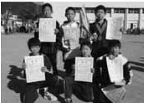
《小学生男子》 “松崎っ子” (松小)