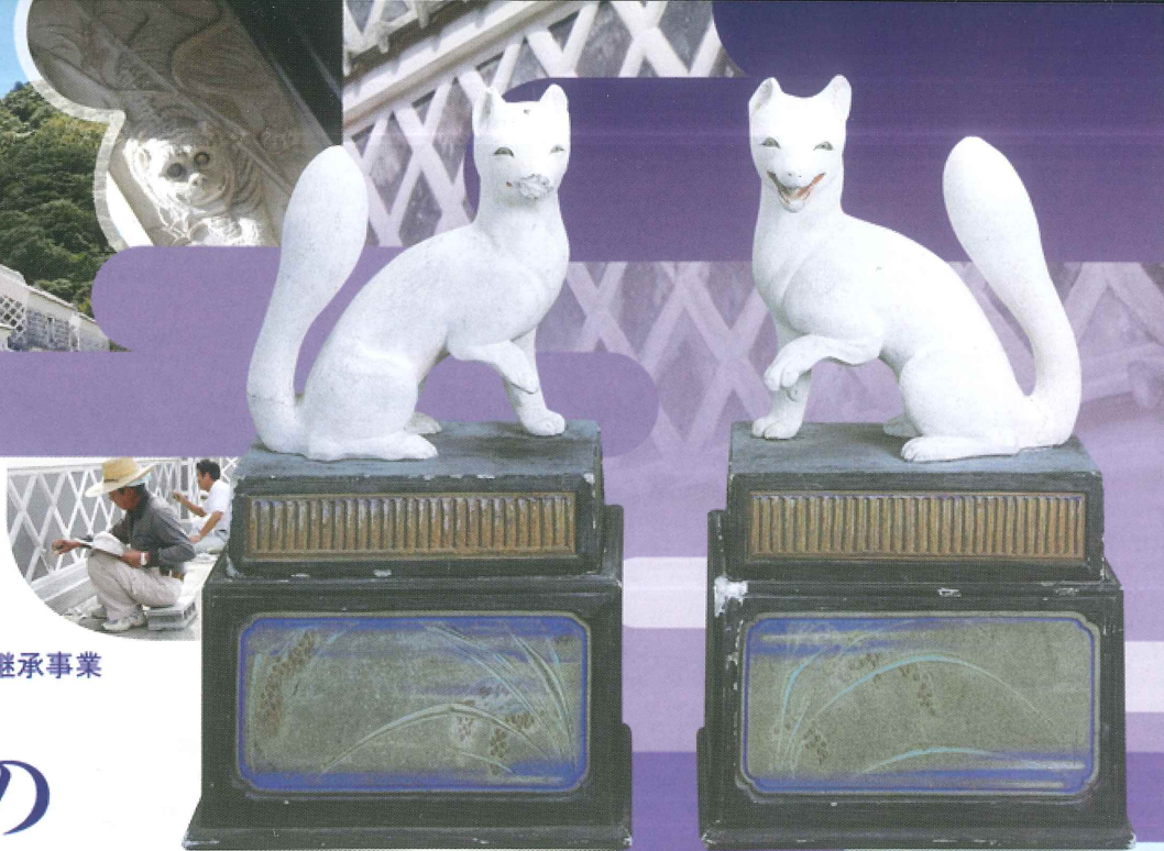
白狐（伊豆の長八美術館蔵）