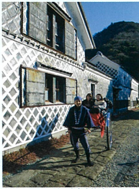
松崎町:なまこ壁と人力車体験