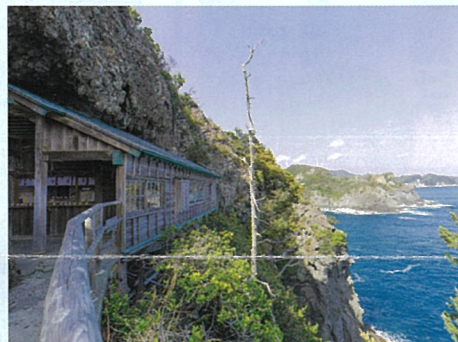
南伊豆町:石室神社 (最寄バス停:石廊崎オーシャンパーク)