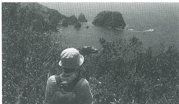
▲展望台から奥石廊崎方面を望む

急な丸太の坂を上ると、大きな灯籠とベンチのある展望台に到着する。奥石廊崎方面の絵のように美しい海岸線を眺めることが出来る。