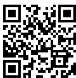
▲日程表/ 申込フォーム