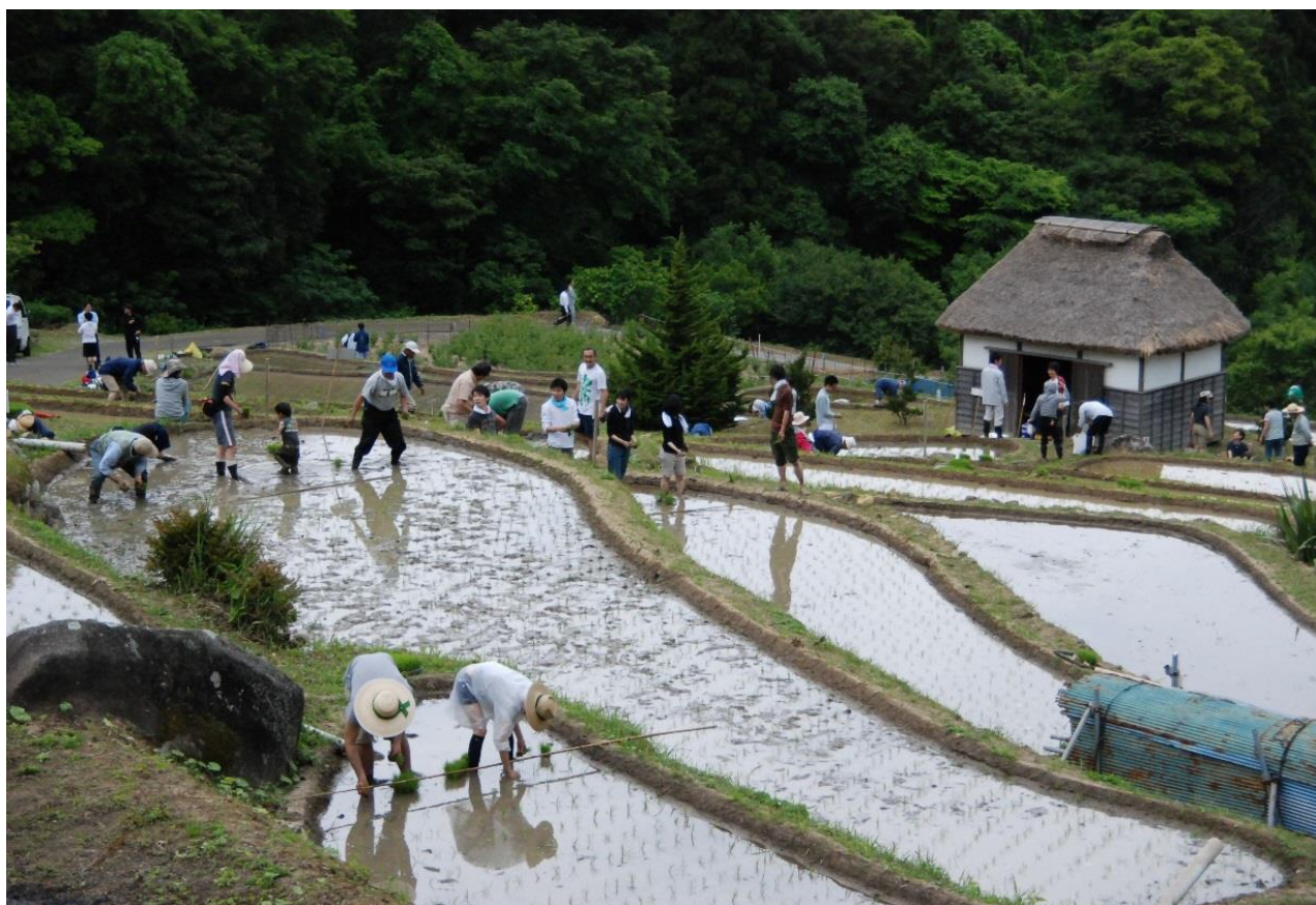
▲石部の棚田・田植え

富士山と海の見える棚田として人気の石部棚田のオーナーを募集する中、約100組の稲作オーナーが誕生しています。オーナーの皆さんには今後、田植や草刈り、稲刈りなどの作業に参加していただきます。尚、今年の田植の日程は下記のとおりとし、オーナーはじめトラスト会員、地元の方々が参加し田植作業が行われます。