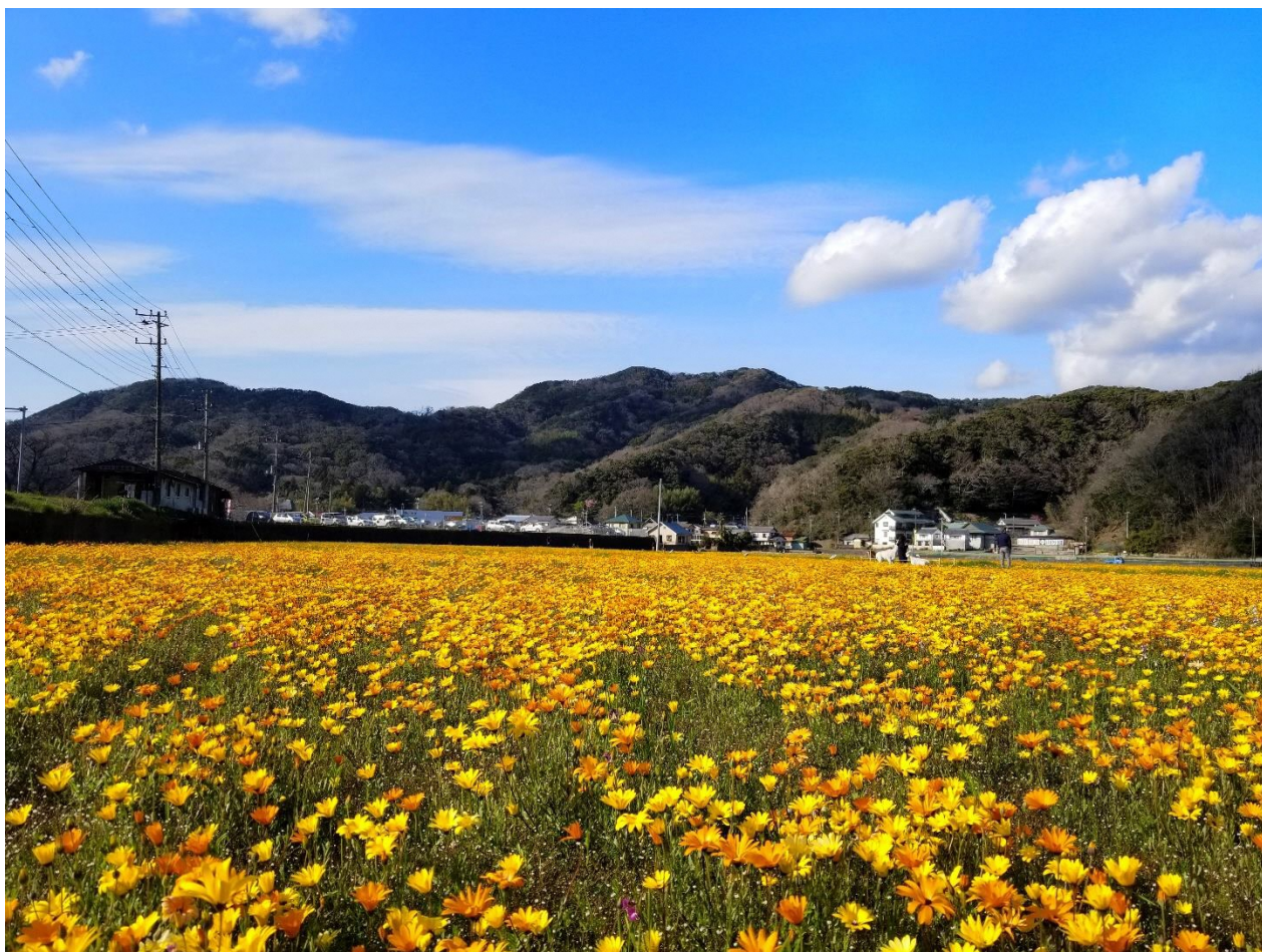
▲田んぼをつかった花畑