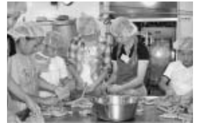
ソーセージ作りを体験（帯広）