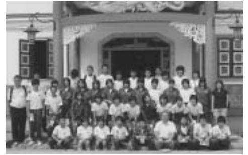
重要文化財旧開智学校前で