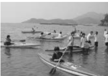
松崎海岸でカヌー一試乗

安曇地区訪問团の中には初めて海に入る生徒もいて、松崎の夏の海を十分に満喫していました。