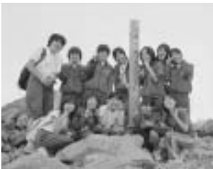
乗鞍岳「剣ヶ峰」山頂で