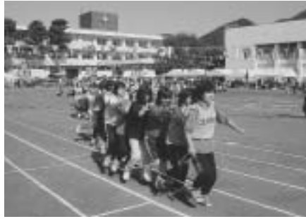
第37回大会（平成15年度）

町民体育大会は、一昨年、昨年と二ヶ年にわたり、悪天候により中止となりました。特に昨年場合は、延期された日も開会後間もなく降り出した雨により中止となり、役員の方々は対応に大変苦労されました。選手集めの大変さ等から昨年度で町民体育大会は廃止との声が町内で聞こえ始めました。