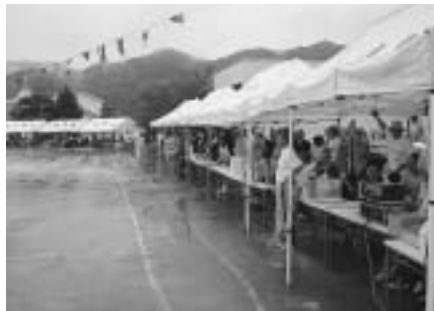
雨で中止となった昨年の大会

町民体育大会は、一昨年、昨年と二ヶ年にわたり、悪天候により中止となりました。特に昨年場合は、延期された日も開会後間もなく降り出した雨により中止となり、役員の方々は対応に大変苦労されました。選手集めの大変さ等から昨年度で町民体育大会は廃止との声が町内で聞こえ始めました。