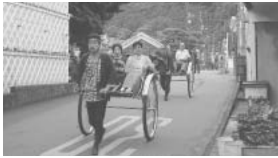
人力車の送迎サービス