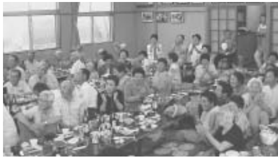
皆さん楽しそうです

今年度満七〇歳以上になる方を対象に、九月十八日から二十日にかけて町内一九会場で敬老会が行なわれました。各地区公民館等では、歌や踊り、ゲーム等趣向を凝らした催しが行なわれ、楽しいひとときを過ごしました。 今年の対象者は二百七十二名で、その内喜寿（七七歳）該当者百一名、米寿（八八歳）は三十二名、九〇歳以上の高齢者は、百四十七名でした。（八月一日現在）