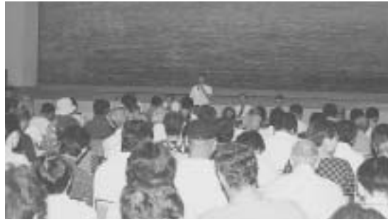
環境センターでの報告会