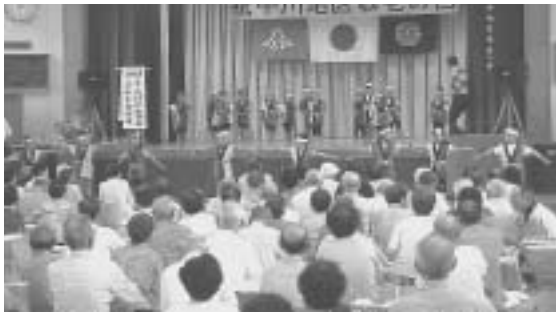
幼稚園児の踊り（中川小学校）