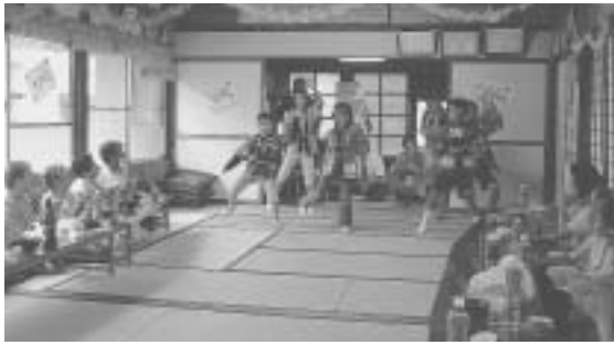
小学生の踊り（指川）