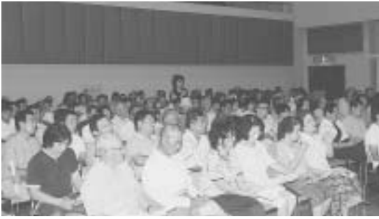
参加者からは意見や質問が

町では去る八月三十日から九月三日までの五日間、町内五会場で町政報告会を開催しました。