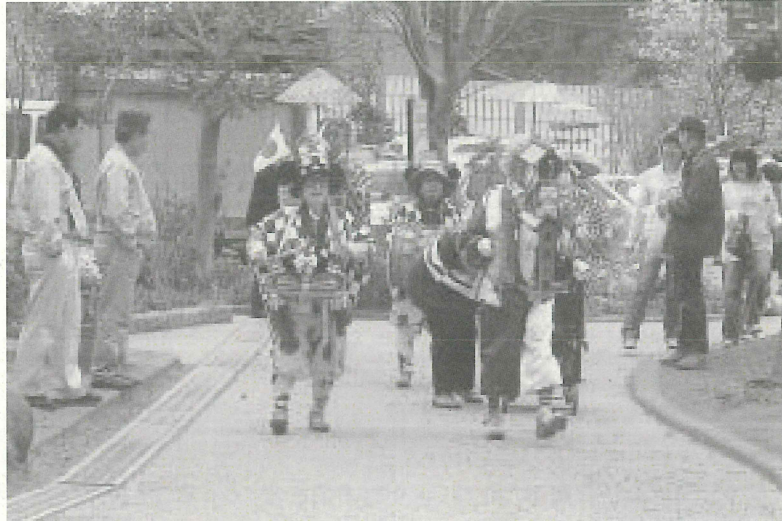
ちんどん屋さん初登場