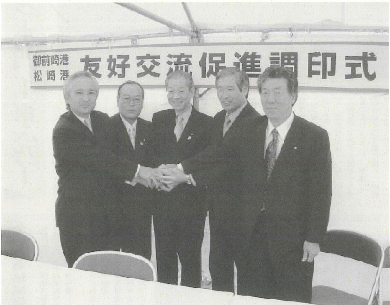
左から西原県議会議員、御前崎町長、石川県知事、相良町長、深澤町長