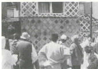
なまこ壁の蔵巡り

四月十八日(日)、岩科小学校周辺を会場に、「第二十回岩科重文まつり」が開催されました。