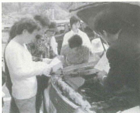
説明を受ける参加者

四月十日(土)、松崎港を会場に、「みなどでみんなと春のピカイチ」が開催されました。 九月の第一日曜日に実施される事が多かったピカイチですが、今回は、地元商店街の活性化を目的に、商店街が営業している土曜日に開催されました。 会場には地場産品の他、地元商店のテナントも設置され、リサイクルマーケットに負けない位盛況でした。商店街の人通りもいつになく多かったです。