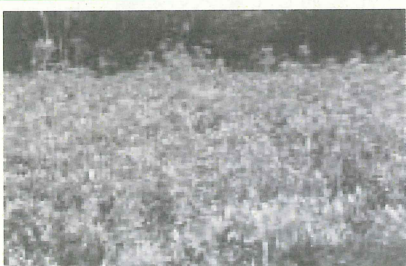
野田越園地のつつじ