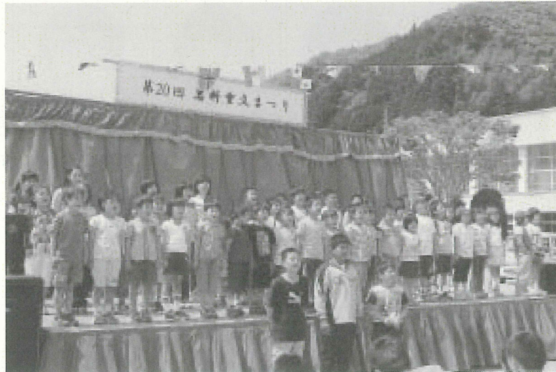
小学生が「『岩科起て』の歌」を熱唱