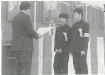
表彰された松崎中学陸上部

一般の観光客だけでなく、同日開催されていたツアーデーマーチの参加者も会場を訪れ、各種サーブিসコーナーや物産コーナーも午前中で品切れ状態になるほど盛況でした。