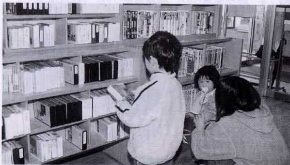
▲人気のビデオコーナー

図書館のビデオの充実を 町立図書館をよく利用させて いただいています。図書館の 一角にビデオの貸し出しコ ーナーがありますが、もつと 種類を増やしていただけない でしょうか。補充などの状況 は、どのようになっています か。