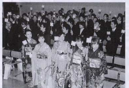
▲ふるさとクイズに挑戦