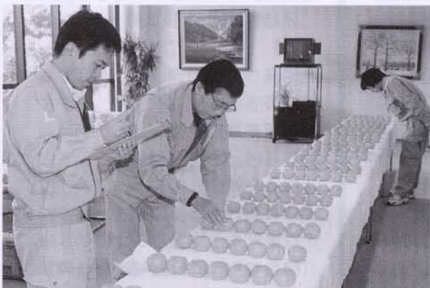
▲参加者の皆さん（村営銀山荘前で）

七人。約半数が初めてのスキー体験でしたが、安曇村指導員のアドバイスを受けながら基本動作をマスターし、二日目には全員が一人で滑れるほどに上達しました。宿泊した村営施設では歓迎会も開かれ、両町村の親睦を深めました。