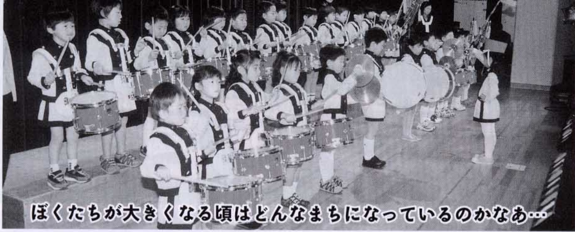
ぼくたちが大きくなる頃はどんなまちになっているのかなあ...

昨年実施された「賀茂地区市町村の合併に関する住民アンケート調査」の結果報告が行われました。今後、住民の意向を踏まえながら本年七月の法定合併協議会設立に向け、枠組みの方向付けが進められます。