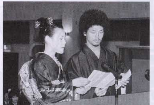
▲新成人を代表して力強く宣誓