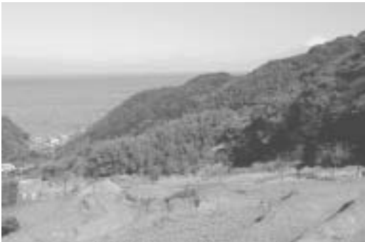
棚田の石部を臨む富士山を眼下に駿河湾を臨む

開会式終了後、川勝平太静岡県知事による「農の理想郷づくり〜棚田を活かす〜」と題した基調講演が行われました。講演のなかで知事は、「日本一高い富士山と日本一深い海である駿河湾を眼下に臨む石部の棚田は、富士の国の最も美しい村であると信じている。」 「石部の棚田は、単に景観が美しいだけでなく、地域の人たちの心と手が加わり、歴史をしつかり刻んでいて、そし