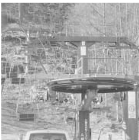
リフトの加重試験