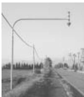
①固定式視線誘導柱

農村部ではまとまった積雪があると、道路の端や歩道の段差の位置が分からなくなることがあります。走行車両が路外に逸脱しないためや、除雪作業のときのガイドとして、北国ならではの道路標識が設置されています。