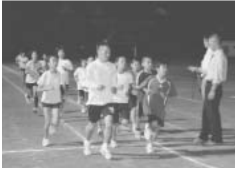
毎週水曜日の夜間合同練習