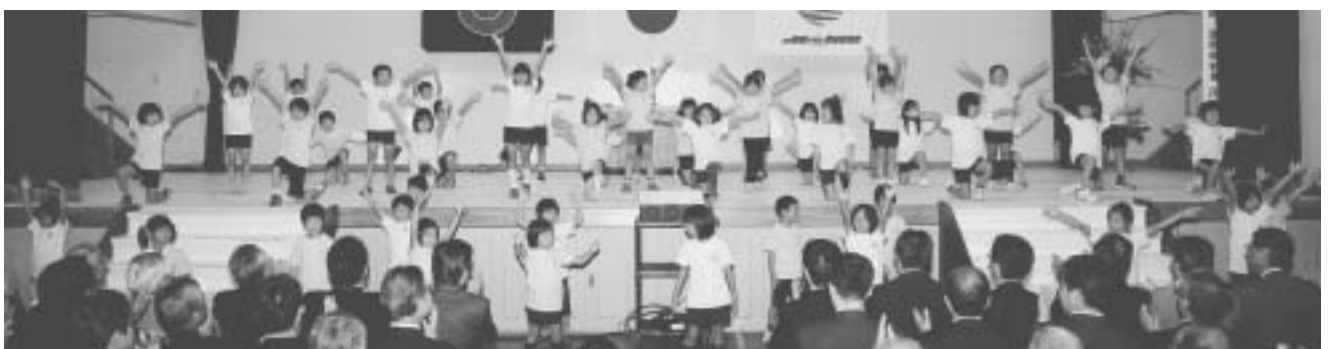
オープニングで松崎小学校2年生がテーマソング「棚田へ行こう!」を斉唱