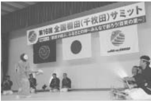
石部三友社により披露された荒神払い

また、会場で提供されたおもてなし料理は、商工会、JA女性部、松崎・中川・雲見の女性会の皆様が、この日に向けて準備した石部で獲れたヒジキやキビナゴ、天草などの地場産品を使った料理で、全国から集まった参加者に松崎の味を堪能していただきました。