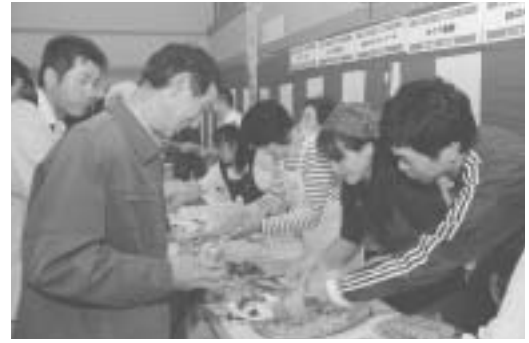
松崎ブランド認定品の試食コーナー

さらに、松崎ブランド試食コーナーも設置され、桜葉や川のりなど地場産品を使ったものから棚田米を使ったものまで、松崎らしい商品を全国の参加者にアピールしました。