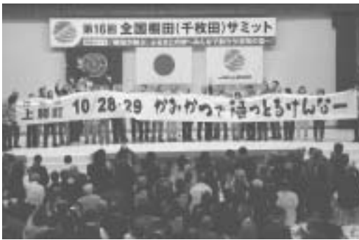
次期開催地(徳島県上勝町)挨拶

さらに、環境改善センターでは、地場産品の販売コーナーや近隣市町のPRコーナーが設置され、伊豆南部の魅力に参加者に発信しました。