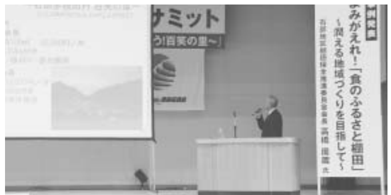
石部地区棚田保全推進委員会の事例発表