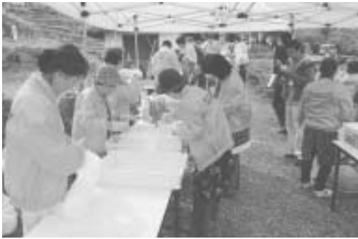
石部地区女性会の皆様によるおもてなし

また、当日は天候にも恵まれ、参加者には、富士山や南アルプスを望む美しい石部の棚田をご覧いただきました。