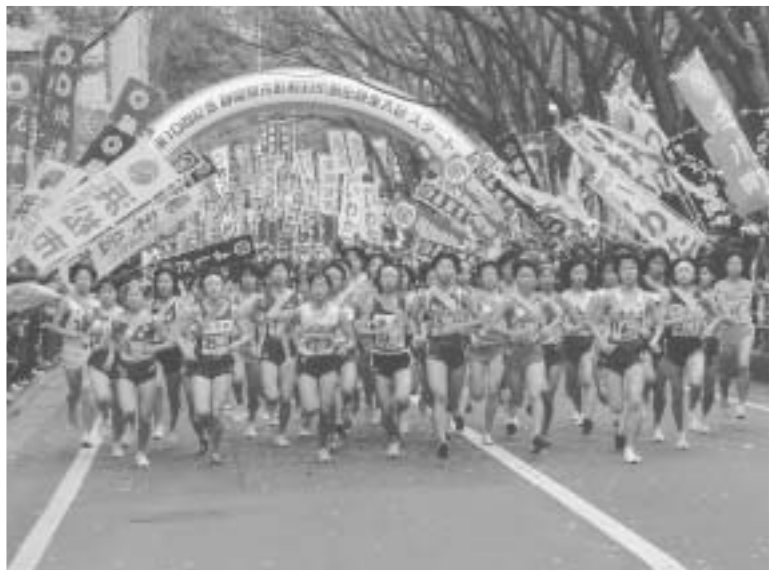
◀ 第10回記念市町対抗駅伝競走大会の様子