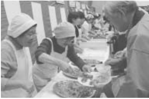
全体交流会では、地元食材でおもてなし