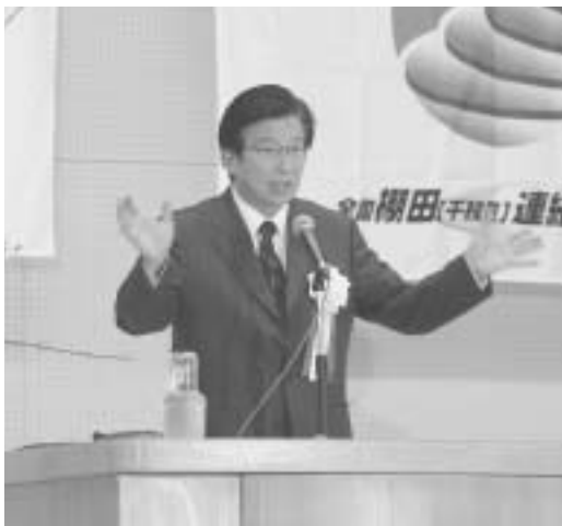
川勝平太静岡県知事の基調講演