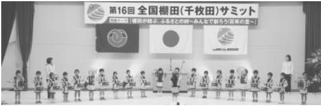
聖和保育園リード鼓隊の歓迎演奏