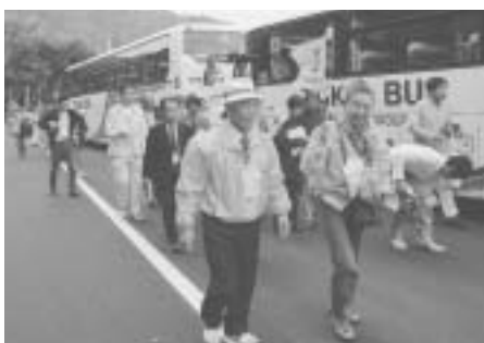
ボランティアの方によるガイド