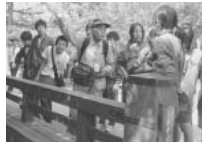
ガイドの案内で上高地を散策