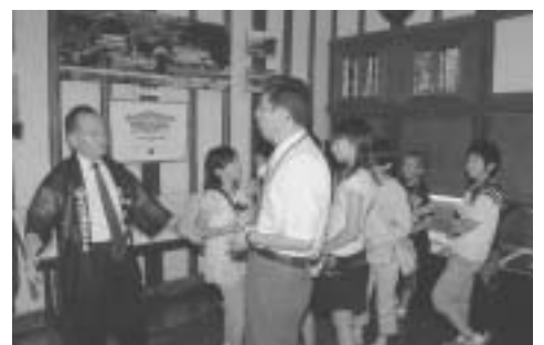
勉三翁の生家を見学