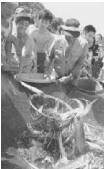
岩地海岸で地引き網を体験