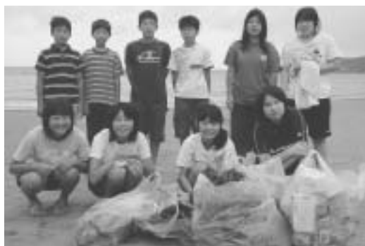
海岸清掃に参加した中学生（8月22日）