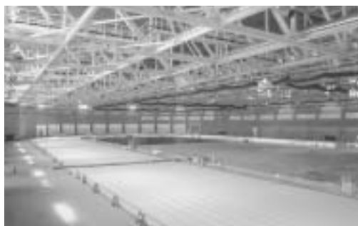
建設中の施設内部

地域おこしや交流人口の拡大にもつなげていくよう、地域あげでの活用が期待されています。