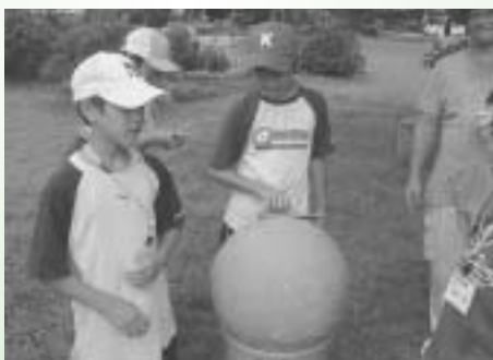
巨大泥だんご作りにも挑戦