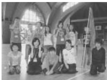
8月10日～11日 富士山交流集会