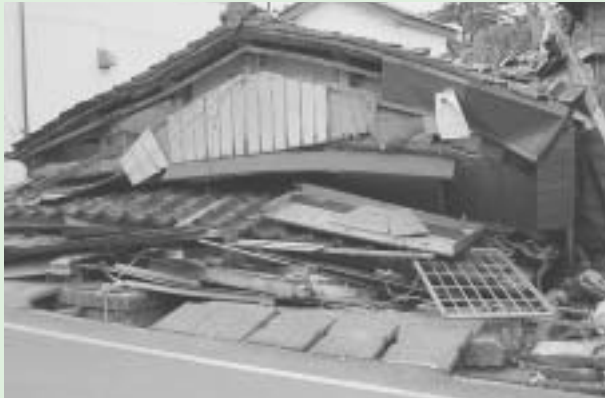
これは平成19年7月に起きた新潟県中越沖地震で倒壊した家屋の様子です。 倒壊した家屋の大半が昭和56年以前の旧建築基準で建てられた木造住宅でした。

予想される東海地震に備え、町では旧基準で建てられた住宅の耐震化に補助制度を実施しています。専門家による無料の耐震診断を受けてわが家の耐震性をチェックし、防災対策を考えるとともに、耐震補強を検討してみましょう。