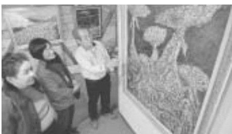
町内の喫茶店併用ギャラリー