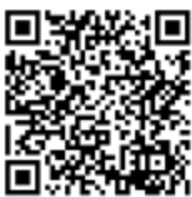
▲松崎町役場がん健診ホームページ

まつざき健康マイレージとは：運動、食事、休養、歯、体重計測の5項目について、自分で目標を設定し、その目標を実行するとポイントがもらえる仕組みです。チャレンジ期間は4週間です。