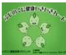
▲ふじのくに健診いきいきカード

検診は予約制です。日程などの詳細は4月に郵送した個別通知や次の二次元コードを読み確認いただくか、健康福祉課までお問い合わせください。