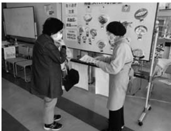
健診会場で減塩普及啓発