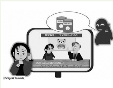
【問合せ】(文と絵)司法書士 山田茂樹 企画観光課 (42)3964

「テレビショッピングを見て注文しようとして電話をかけた後、別の商品の勧誘を受けた」