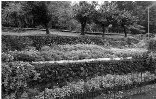
優秀賞 松尾区（松尾）

松崎町花の会（建久寺） 船田寿会（船田） 桜田区・フラワーマイツ（桜田） 山口区（山口） 南郷楽寿花の会（南郷） 伏倉区（伏倉）