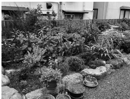
最優秀賞 藤井 すえ子（西区）