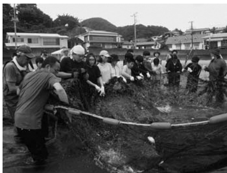
▲岩地海岸での地引網体験

2日目は、岩地海岸で地元の方たちと力を合わせ地引網体験をした後、海水浴やシーカヤックを体験し岩地の海を満喫しました。午後からは、松崎海岸で松崎中学校2年生とビーチドッジボールなどで交流を深めた後、重文岩科学校で松崎の歴史文化を学びました。