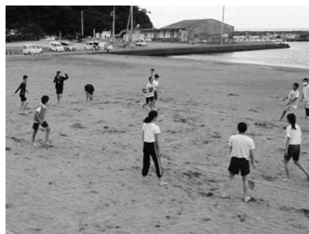
▲松崎海岸でのビーチドッジボール

最終日は、松崎中学校でお互いの地域を紹介し合うプレゼン交流を行いました。その後、長八美術館を見学し、漆喰を使った「光る泥だんご」づくりを体験して松崎を後にしました。