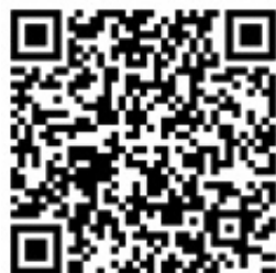
▲「ぶしのくに静岡県」ホームページ