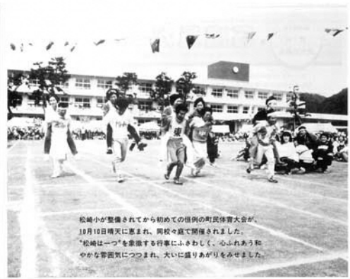
松崎小が整備されてから初めての恒例の町民体育大会が、18日晴天に恵まれ、同校で開催されました。「松崎は一つ」を象徴する行事にふさわしく、心ふれあう和やかな雰囲気につつまれ、大いに盛りあげられました。

人口と世帯 世帯数 2,837 総人口 9,828人 男 4,912人・女 4,916人 世帯数 824世帯 出生 18人・死亡 11人