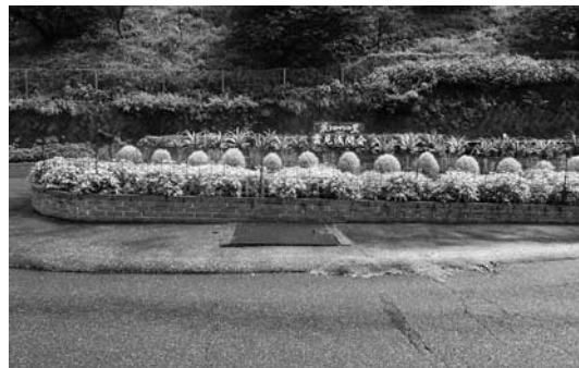
優秀賞 浅間会（雲見）