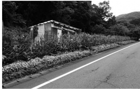
最優秀賞 花の親睦会（小杉原）