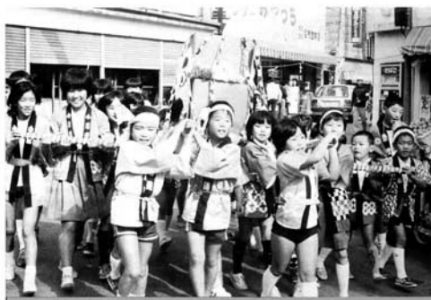
子供たちの協力性と創造性を育てていくことを目指して、恒例の「松小まつり」が開催され、工夫を凝らした16基の手作りみこしの練りが、商店街通りを「ワッショイワッショイ」と気勢を上げ、まつり気分を盛り上げました。

人口と世帯 世帯数 3,037 総人口 10,819人 男 5,361人・女 5,458人 世帯数 824世帯 出生 18人・死亡 11人