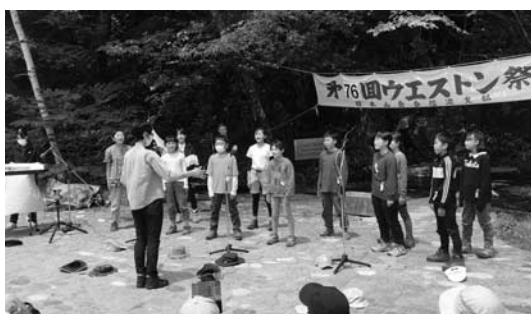
▲小学生による合唱

その上高地に深く関わりのあるウエストン碑前に参加することをも楽しみにしていました。今年には新型コロナウイルスの感染が落ち着き、大勢の松崎町の皆さんに上高地を訪れていただき、交流できることを願うばかりです。